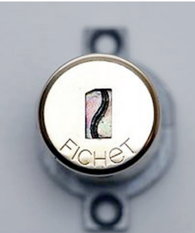
Il cilindro Fichet 787

Tutte le porte Piccioni Fichet beneficiano della possibilità di detrazione fiscale del 65%, fornendo a chi le acquista un credito di imposta per dieci anni. Un esempio? Su un acquisto da 3000 euro il cliente ne recupererà 2000. Insomma, è il momento di affrettarsi se si ha intenzione di rinnovare la propria casa rendendola più sicura.