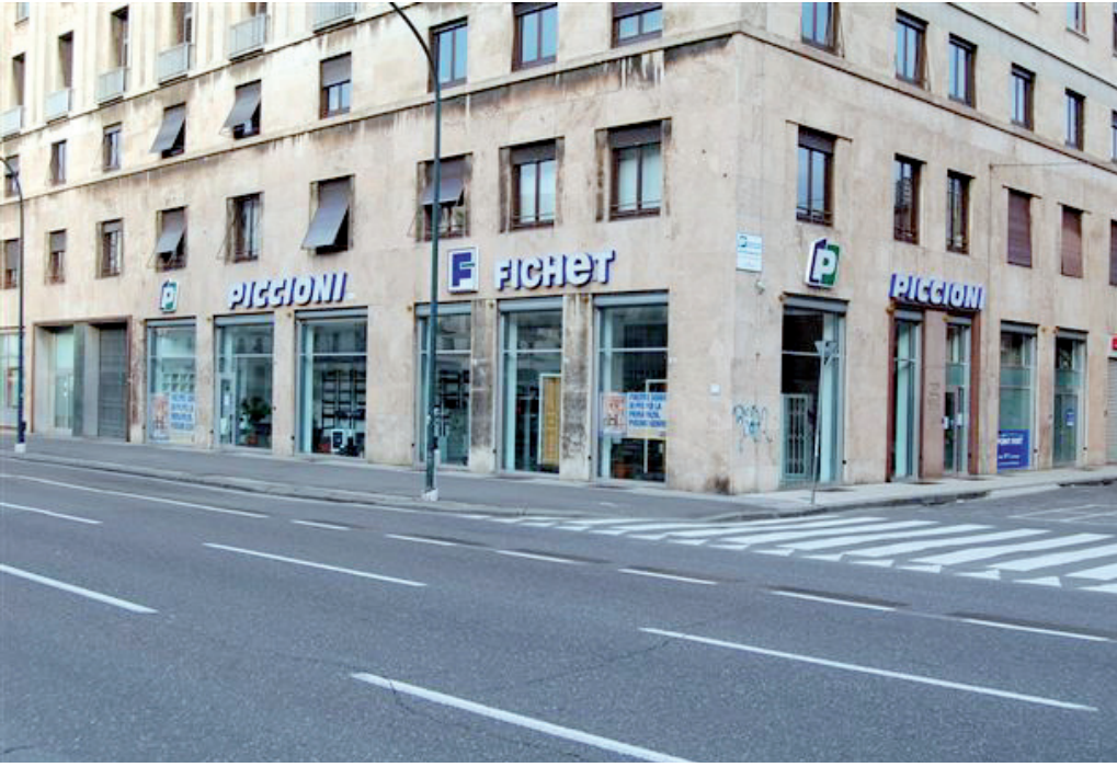
Un'immagine del punto vendita Piccioni - Fichet in via Brigata Bisagno a Genova

ineguagliabile. E come fare per seguire tutte le pratiche necessarie per avere queste agevolazioni? Nessun problema, anche in questo caso ci pensa Piccioni Fichet, per dare al cliente un servizio che sia veramente "chiavi in mano". Ma non è finita qui. Infatti anche tutte le porte blindate Piccioni Fichet beneficiano della possibilità di detrazione fiscale del 65%, fornendo a chi le acquista un credito di imposta per dieci anni. Il tutto ovviamente con uno studio di fattibilità di un tecnico di fiducia dell'azienda. Insomma, in questo periodo storico in cui avvengono molti più tentativi di scasso nelle abitazioni il consiglio è quindi quello di affrettarsi se si ha intenzione di rinnovare la propria casa rendendola più sicura recandosi nell'ampio punto vendita di Piccioni Fichet a Genova in via Brigata Bisagno, dove sarà possibile toccare con mano la qualità dei prodotti offerti e chiedere consigli ed informazioni agli esperti del settore.