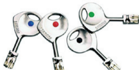
Le chiavi originali Fichet 787

Per tutti coloro che desiderano saperne di più e avere maggiori informazioni è pos-