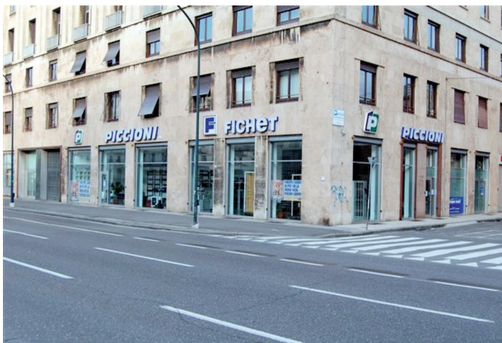
Un'immagine del punto vendita Piccioni - Fichet in via Brigata Bisagno a Genova

È il nuovo incubo per i cittadini, un vero e proprio passepartout della microcriminalità, una chiave capace di aprire tutte le porte con serratura a doppia mappa e di seminare il panico nelle città italiane, soprattutto in questo periodo di vacanza. È la "chiave bulgara", nata ai tempi della Guerra Fredda, ideata dai servizi segreti bulgari per violare le serrature di ambasciate o uffici di paesi stranieri senza farsi sorprendere. Oggi è l'attrezzo privilegiato per scassinatori e ladri sempre più attrezzati e specializzati che la utilizzano per aprire anche le porte blindate con serratura a doppia mappa e lo fa senza scasso e quando si torna a casa, il furto lo si scopre solamente dopo avere aperto la porta. Questo si va ad affiancare al più "classico" Key Bumping che sta sempre più allarmando i cittadini.