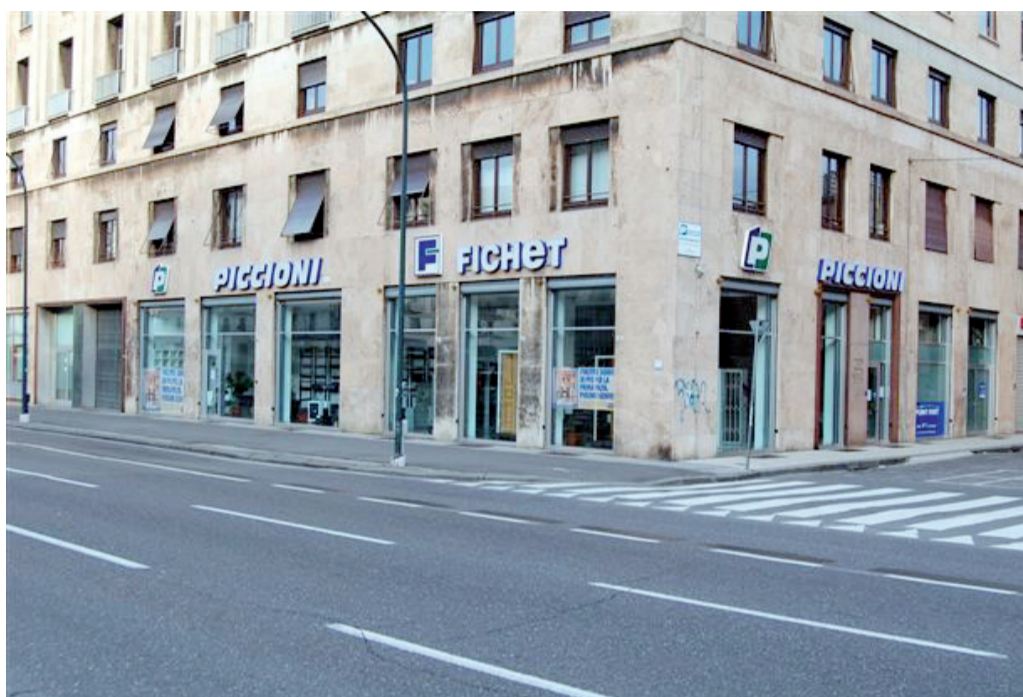
Un'immagine del punto vendita Piccioni - Fichet in via Brigata Bisagno a Genova

Si tratta davvero di un'opportunità da cogliere al volo, anche perché non sappiamo ancora se la possibilità di de-