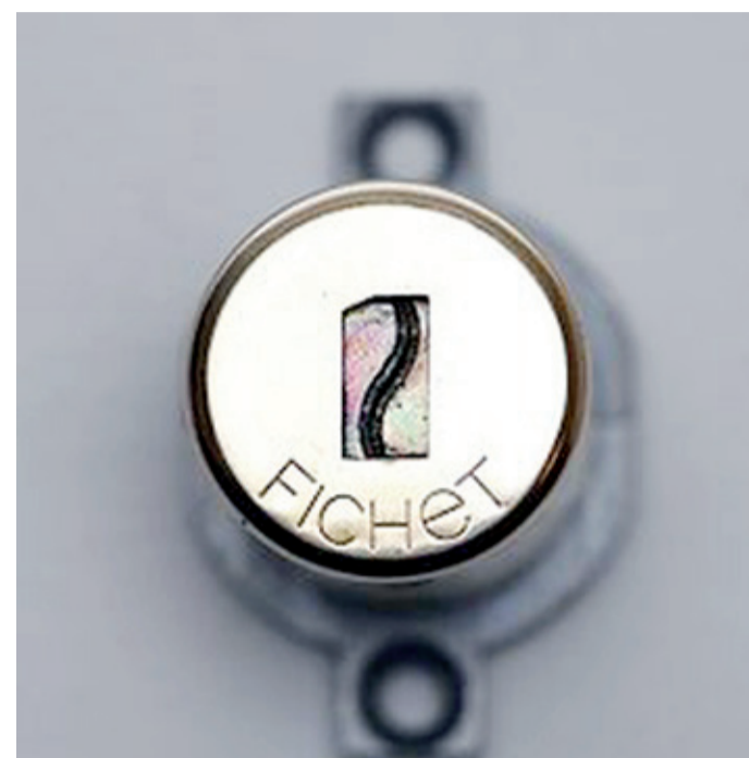
Il cilindro Fichet 787