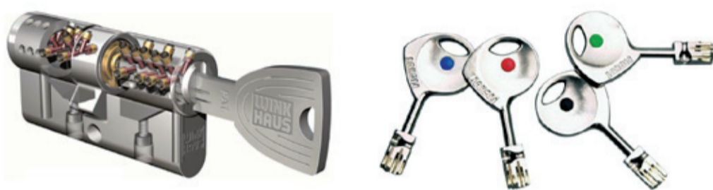
Il cilindro delle nuove serrature Piccioni